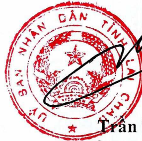
Trần Tiến Dũng CHỦ TỊCH UBND TỈNH